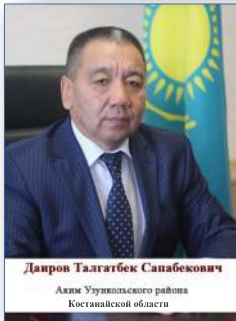
Данров Талгатбек Санабекович Аким Узункольского района Костанайской области