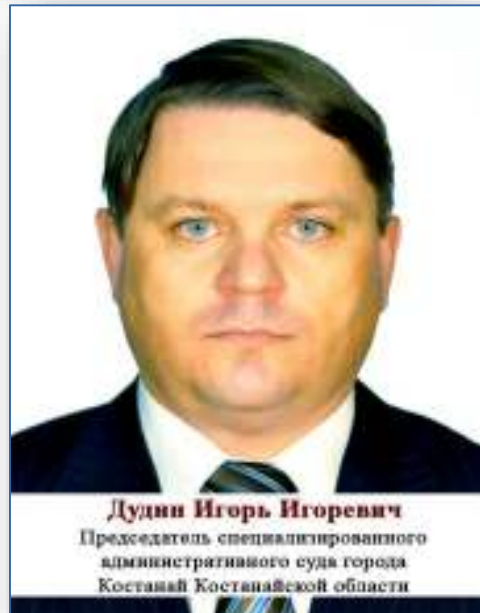
Дудин Игорь Игоревич Председатель специализированного административного суда города Костанай Костанайской области