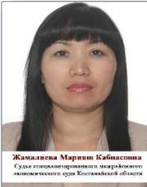
Жамалиева Марияш Кабисовна Судья специализированного межрайонного экономического суда Костанайской области