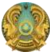
Комиссия по правам человека при Президенте Республики Казахстан