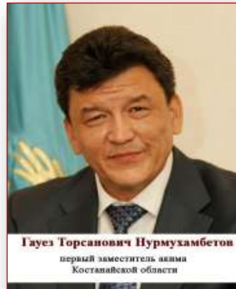
Гаузе Торсанович Нурмухамбетов первый заместитель акима Костанайской области