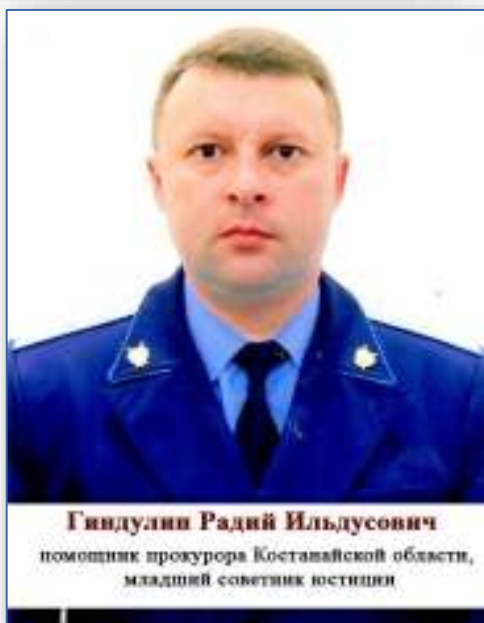
Гиндулин Радий Ильдусович помощник прокурора Костанайской области, младший советник юстиции