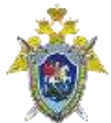
Академия Следственного комитета