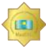
Академия государственного управления при Президенте Республики Казахстан